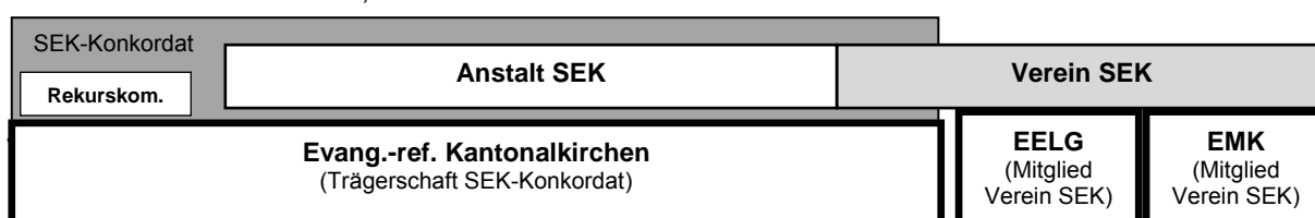
Schema: mögliche Form eines Konkordatsmodells