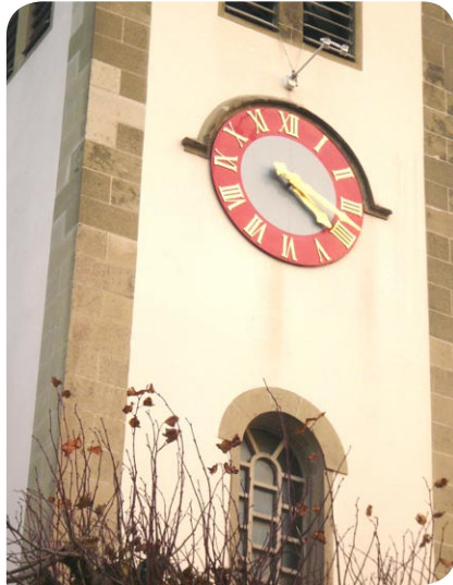
Donnons du temps au Saint-Esprit dans notre culte! – Le clocher de l'église de Forel.

En septembre 2009, une petite équipe de pasteurs et laïcs anglicans ont rendu visite à des pasteurs de l'EERV. L'occasion de cette rencontre était de les entendre parler de leur apprentissage et expériences du ministère du Saint-Esprit; c'est-à-dire le ministère de puissance que Jésus a reçu de Dieu son Père lors de son baptême, et qu'il a confié à ses disciples avant d'aller vers le Père.