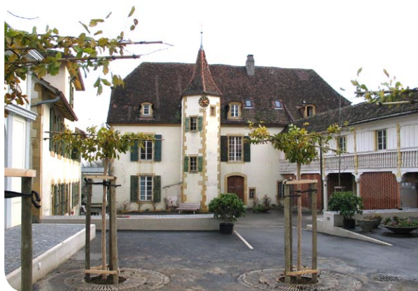
Seit dem 18. Jahrhundert ein Ort der Gemeinschaft über kirchliche Grenzen hinweg: Montmirail bei Neuchâtel.

Die Tagungsleitung legte dem Plenum ein Verständnispapier vor, das in Arbeitsgrup-